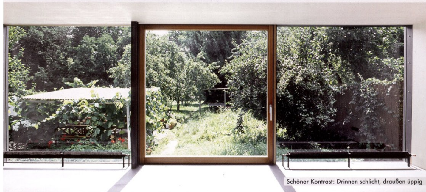
Schöner Kontrast: Drinnen schlicht, draußen üppig

Es war nicht leicht, die Behörden von diesem reduzierten Entwurfskonzept zu überzeugen, doch Planer und Auftraggeber kämpften gemeinsam und mit Erfolg. Eine Kooperation, die man eben nur vom Architekten bekommen kann, eine echte Partnerschaft in allen Belangen des Bauens.